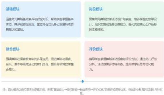
图 2 基于职业需求的模块化课程内容结构示意图

以具体项目为载体，如设计主题律动活动培养学生的综合应用与创新能力；游戏化学习将舞蹈技能训练融入趣味游戏，激发学生兴趣的同时体验幼儿学习方式；数字化深度应用借助 VR/AR、动作捕捉等技术模拟复杂教学场景辅助教学与评价（见表 2），多种教学方法协同运用有效提升教学的实践性与趣味性。